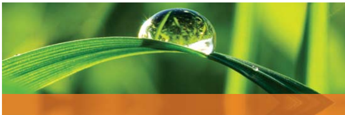
ATMOSPHÄRE DES VERTRAUENS